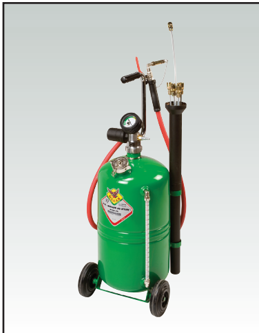
ASPIRATORE PNEUMATICO OLIO ESAUSTO CON SERBATOIO PORTABILE DA 24 l AIR-OPERATED WASTE OIL DRAINER WITH PORTABLE 24 l TANK